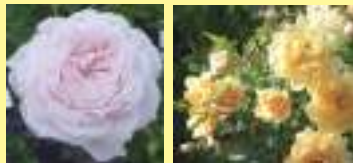
いちご大福 プチ・カスタード

※5月初旬より開花状況によって随時展示します。初公開のオリジナル品種も展示予定です。