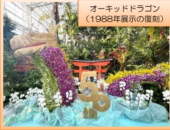
オーキッドドラゴン (1988年展示の復刻)