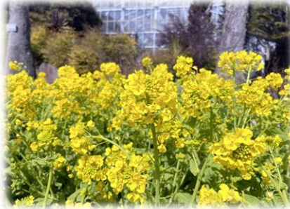
ハナナ '京都伏見寒咲' (大温室前、カスケード)