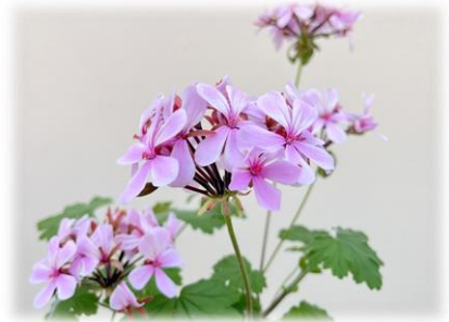
ペラルゴニウム アクラエウム (展示温室)