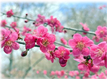
ウメ '佐橋紅' (ウメ園)