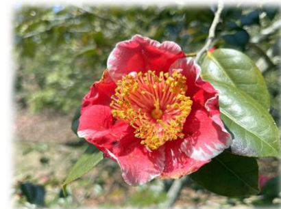
肥後椿 '紅宝' (ツバキ園)