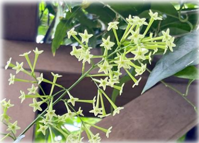
ヤコウボク (大温室)