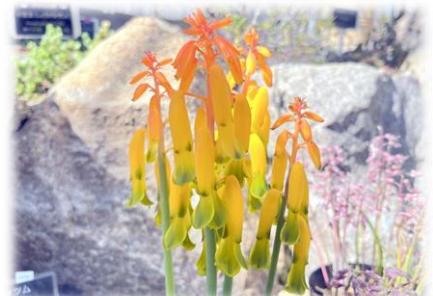
ラケナリア カリスタ (サボテン温室)