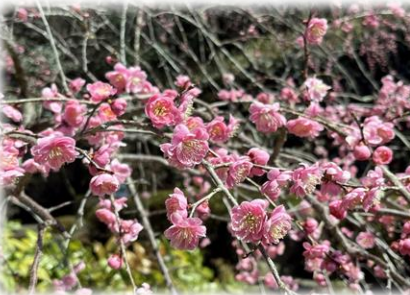
ウメ '藤牡丹枝垂れ' (日本庭園)