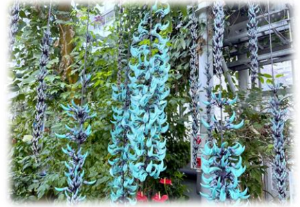
ヒスイカズラ (大温室)