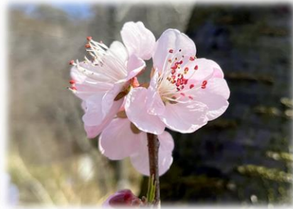
ハナモモ '雛遊び' (日本庭園)