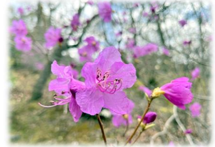
ゲンカイツツジ (ロックガーデン、芝生広場奥)