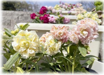
ストック (カスケード)

3/22(土)からさくらまつりが始まります！ 夜間開園は3/29、3/30、4/5です！