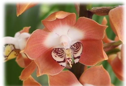
ネオムーレア ワリシー (フクシア温室)