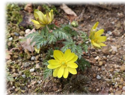
ミチノクフクジュソウ (里山の野草園)