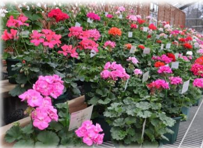
ゼラニウム (展示温室)