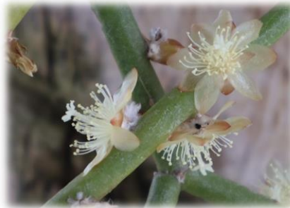
リップサリス ヘプタゴナ (サボテン温室)