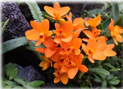
リンカトリアンセ 'ヤンミンオレンジ' (大温室)