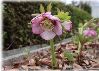
クリスマスローズ (ベゴニア温室前)