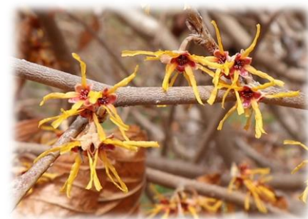
ハヤザキマンサク (芝生広場)