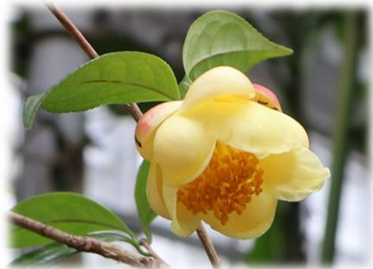
モウジキンカチャ (大温室)