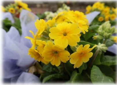
プリムラ (カスケード)

3/22 (土) からさくらまつりが始まります! 夜間開園は3/29、3/30、4/5です!