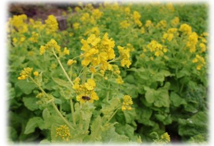
ハナナ '京都伏見寒咲' (大温室前、カスケード)