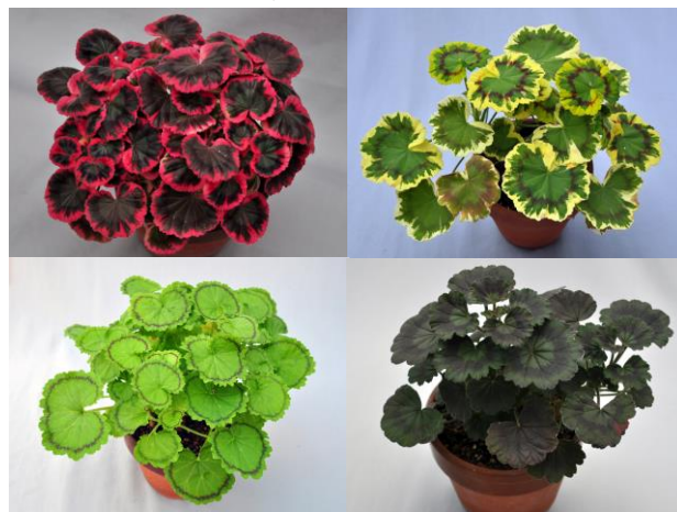
「変わり葉ゼラニウム」 (ナショナルコレクション認定)