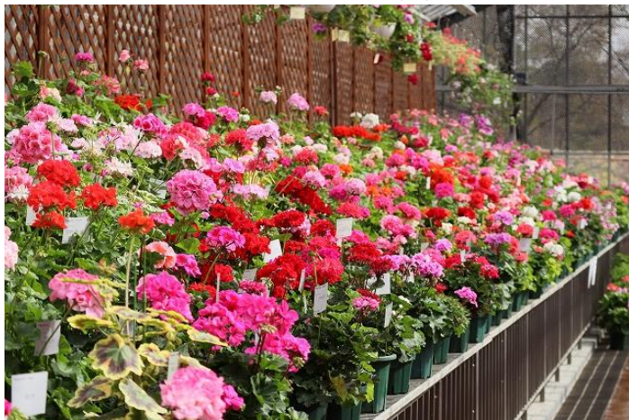
過去の展示の様子