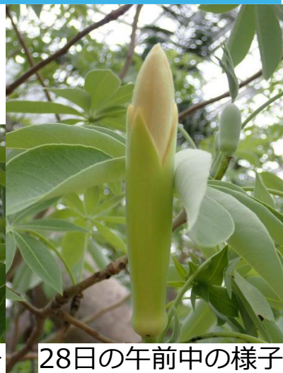
28日の午前中の様子