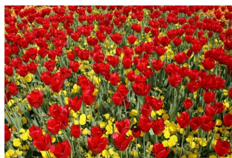
3・4月:チューリップ