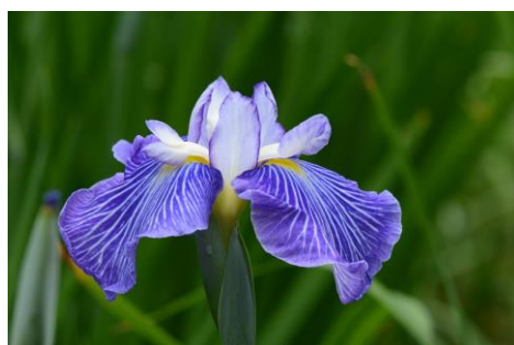
5・6月:ハナショウブ