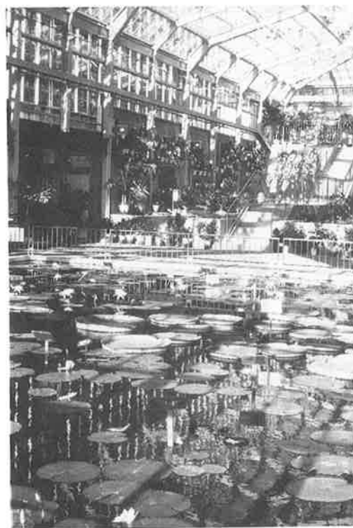
熱帯スイレン温室

今後、展示植物の充実のため、原種や新しい品種の導入および他の水生植物の導入を行い、あわせて品種改良のための交配も行っていきたいと考えている。