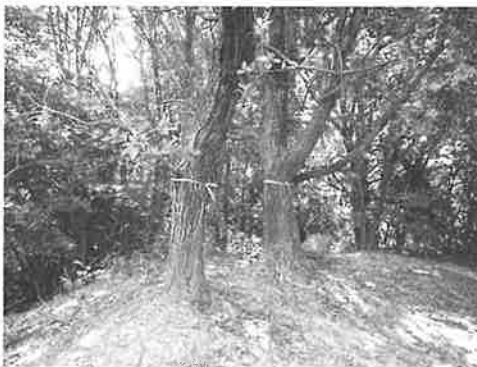
写真3 ウバメガシ(8~10)伐採前の様子