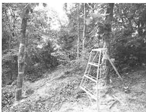
写真2 アメリカガシワ(7)伐採後の周辺の様子