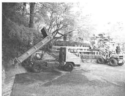
写真1 茶室前植栽改変作業の様子