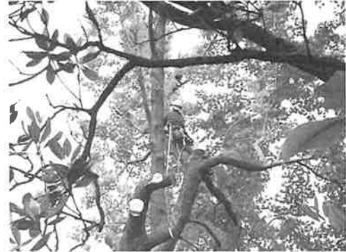
写真5 マテバシイ (40) 伐採作業の様子