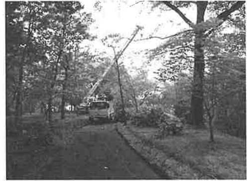
写真4 アメリカカフウ (35) 伐採作業の様子