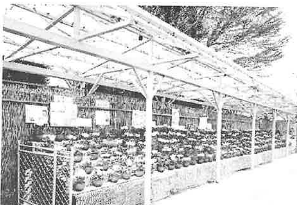
図1 令和2(2020)年度サクラソウ展の展示風景

令和2年度の展示概要を表2に示す。展示は4月15日(水)~4月16日(木)にかけて、植物公園屋外展示場にて実施した。展示に際しては、植物公園植物友の会植物同好会に出品協力を依頼した他、会員によるサクラソウ苗の売店も設置した。