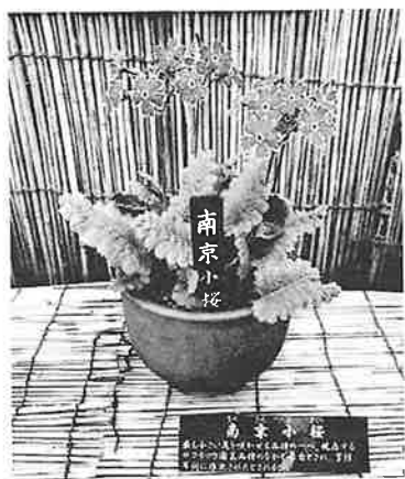
図4 サクラソウ展示方法

後8日が経過したものについて、いずれも顕著な汚損や劣化は見られなかった。文字の大きさは、目線から壁面のパネルまでの距離が約1.5m あったため、タイトル72pt、本文36pt以上に設定した。また、導入部分をはじめとする複数の解説については、英語表記を加えて紹介した。