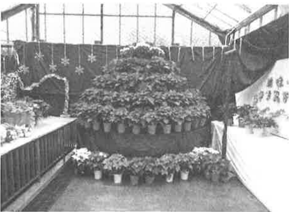
写真3 ポインセチアで作ったクリスマスツリー