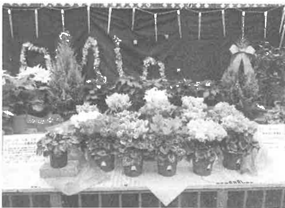
写真1 クリスマスの時期に見頃を迎える花やクリスマスと名の付く花を展示するコーナー展示風景

今回の展示を通して多くの課題が見つかった。クラフトの雪だるまが、触られるとすぐにボロボロになってしまったことや、リースなどのクラフト用の材料集めを始めるのが遅く、ボランティアの方々に頼みになってしまったこと、展示温室内の電飾が少なく夜間開園時に電飾だけでは温室内が暗く雰囲気作りがうまくいかなかったことなどである。来年度はこれらの課題を解決し、より良い展示にしていきたい。