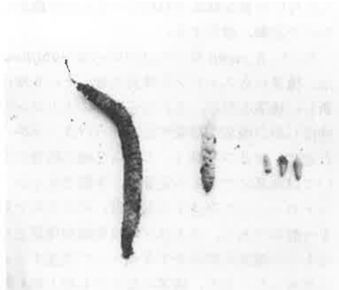
コーレリア・ボゴテンシスの尾状地下茎(左端)、中央はグロキシニア・クンデニアナ、右はアキメネス