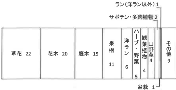
図3. 園芸相談内容別割合 (%) (平成25年度)