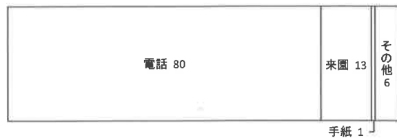
図2. 園芸相談受付方法別割合 (%) (平成25年度)