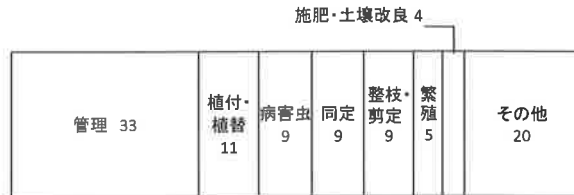
図4. 園芸相談作業別割合 (%) (平成25年度)