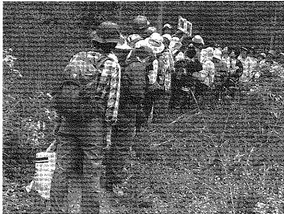
写真3 野外観察会(島根県赤名湿地)

秋の観察会は同大学中坪教授を講師とし、同場所の観察を行った。秋という事で花は春よりは少なかったが、ワレモコウ、アキノタムラソウ、ツリフネソウ、ヒガンバナなどの花があり、奇妙なギンリョウソウモドキも観察する事ができた。時間に余裕があり、春と同様、赤穴八幡宮の植物観察とさらにリンゴ狩りを楽しんだ。