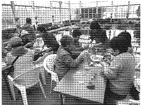
写真4 コサージュ作り教室

平成23年度は19人が管理ボランティアとして登録され、カスケードのモザイカルチャーやハンギングバスケットの植え込み、設営にも携わり、活動した。