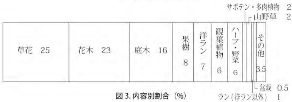
図3. 内容別割合 (%)