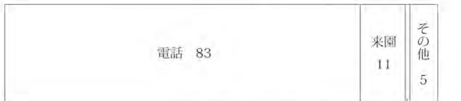
図2. 受付方法別割合 (%)