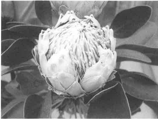
写真3.キングプロテア