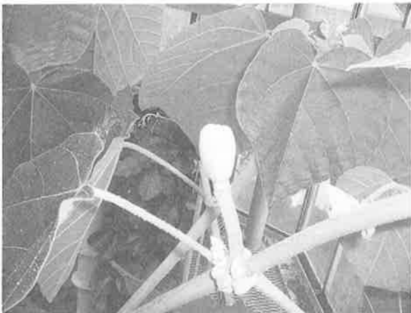
写真1. 旧枝から出ている蕾

花弁は5個、雌しべの柱頭は5分枝し、らせん状にねじれていた。雄しべは5個で2個の葯が合着し、それが複雑に折れ曲がり、花糸に付いていた。（写真3）