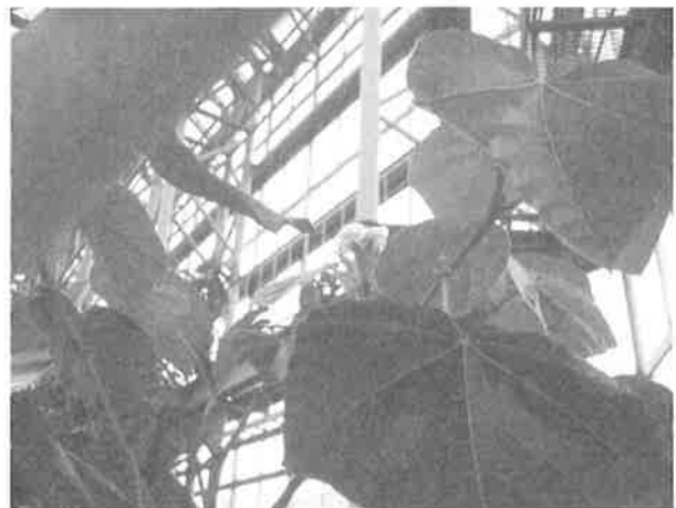
写真4. 開花時の株の様子