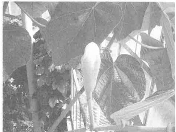
写真2. 開花直前の状態