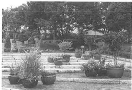
カスケード周辺のコンテナ設置風景

立体花壇は、5月中旬にベゴニア・センパフローレンス、11月中旬にビオラを植えた。