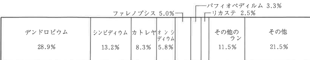
図5. 洋ランクリニック植物別割合 (総受付件数121件)