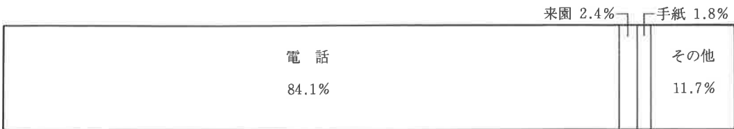
図2. 受付方法別割合