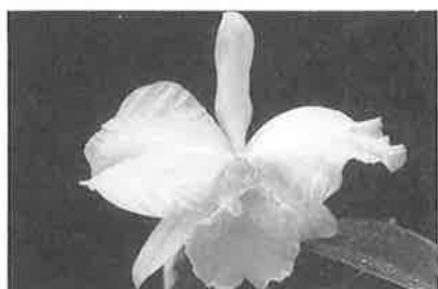
× Sc. (C. Dinah × Soph. coccinea)

弁質は薄く，C. Dinah の特徴を表わしているが，開花期は Soph. coccinea の開花期になっている。