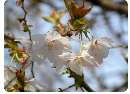
三波川冬桜 (芝生広場)