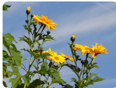
ニトベギク (皇帝ヒマワリ) (花の進化園)