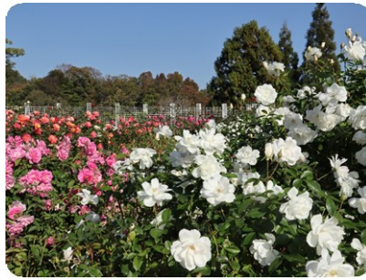
四季咲きバラ (バラ園)