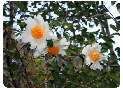
グランサムツバキ (ツバキ園奥)