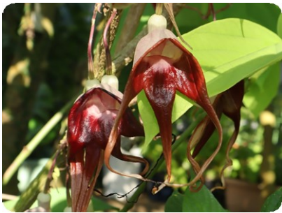
アリストロキア・トリカウダタ (大温室)