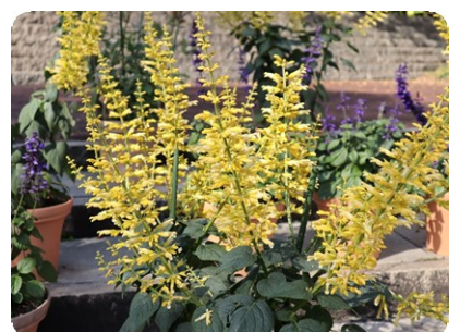
サルビア 'イエローマジェスティ' (カスケード)