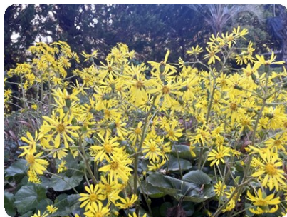
ツワブキ (園内各所)