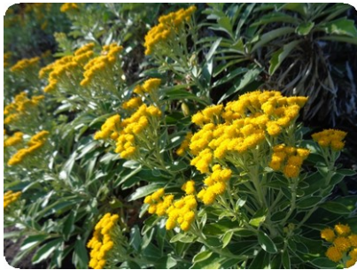
イソギク (ロックガーデン)