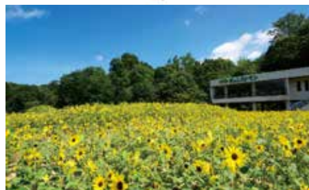
夏の風物詩 ヒマワリの丘

着替えスペースを用意しています。 新型コロナウイルス対策で人数制限する場合があります。