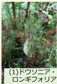
(1)ドウソニア・ロンギフォリア

コケの楽しみ方は無限大。もふもふなコケを愛でるもよし。育てるもよし。身近な暮らしを彩るコケテラリウム作家mom.さんによる素敵なテラリウム作品 (4) もお見逃しなく。