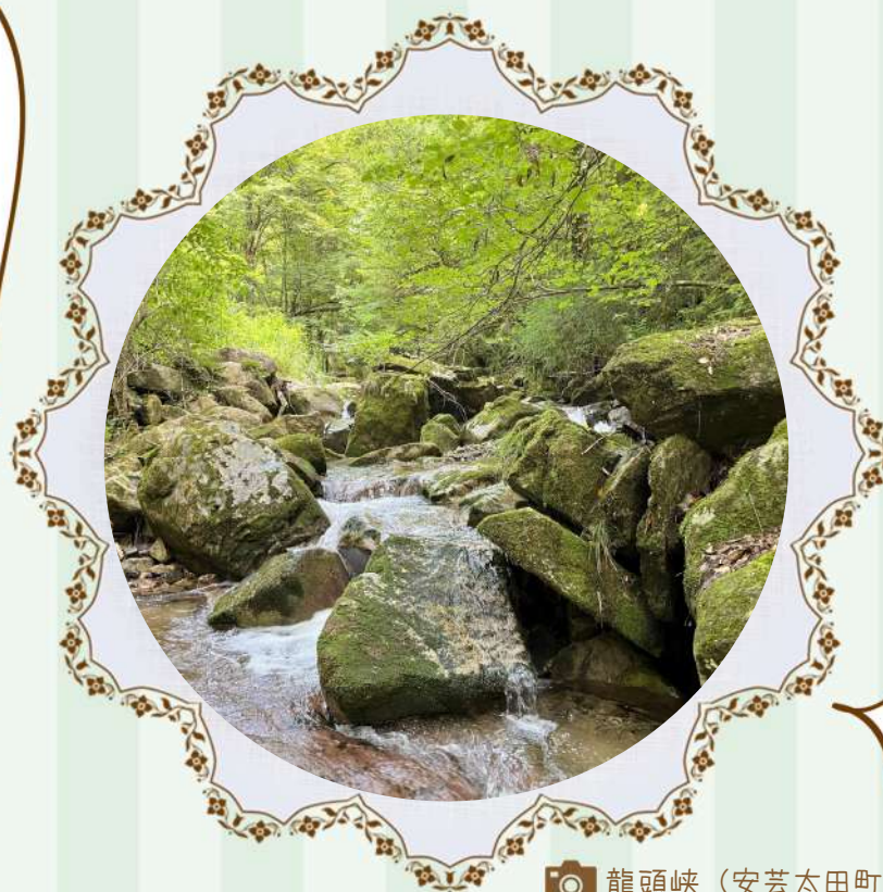
📷 龍頭峡 (安芸太田町)