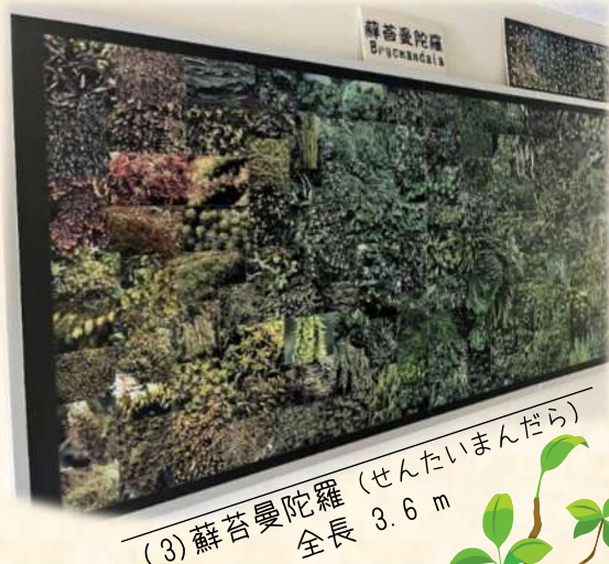
(3)蘇苔曼陀羅 (せんたいまんだら) 全長 3.6 m