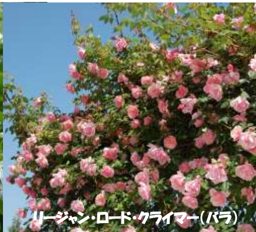
リージャン・ロード・クライマー(バラ)