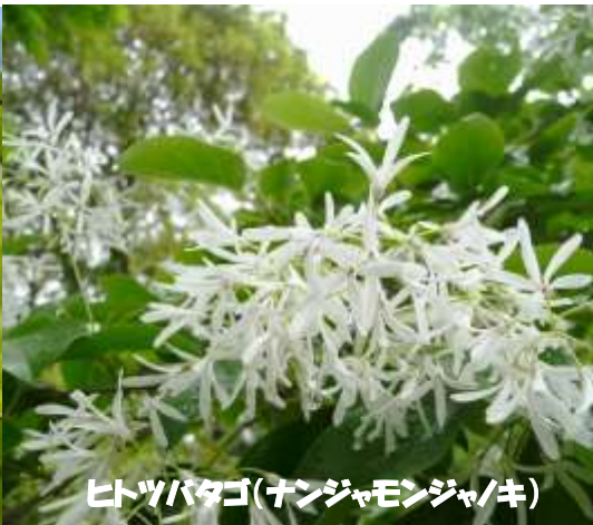
ヒツバタゴ(ナンジャモンジャ/キ)