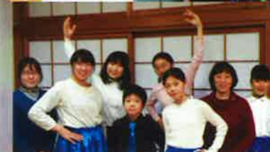
子どもオペレッタ フェリシアと仲間達