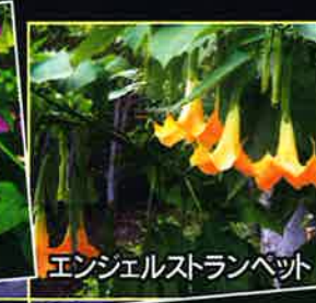
エンジェルストランペット