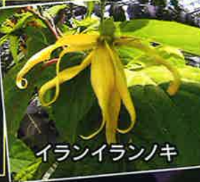
イランイランノキ