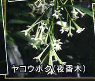
ヤコウボク(夜香水)