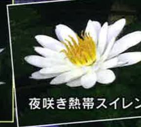
夜咲き熱帯スイレン