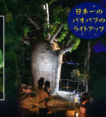
日本の バオバブの ライトアップ