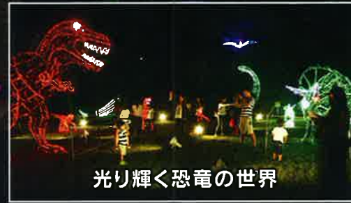
光り輝く恐竜の世界