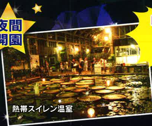
熱帯スイレン温室