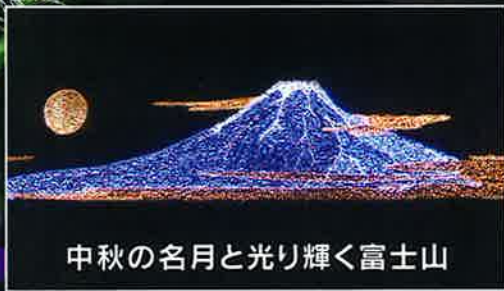
中秋の名月と光り輝く富士山