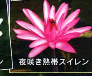
夜咲き熱帯スイレン