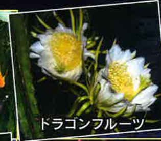
ドラゴンフルーツ