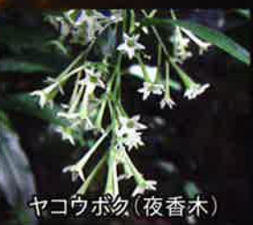
ヤコウボク(夜香木)