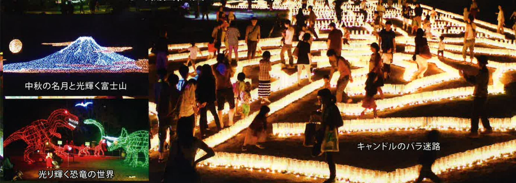
中秋の名月と光輝く富士山