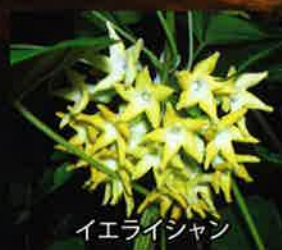
イエアイシャシヤン