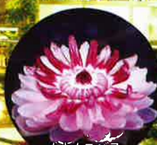
オオオニバスなどのライトアップ