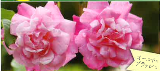
オールド・フラッシュ