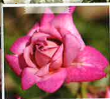
オーキッド・マスターピース