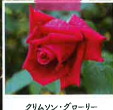
クリムソン・グローリー