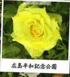
広島平和記念公園