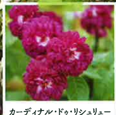
カーディナル・ドゥ・リシュリュー