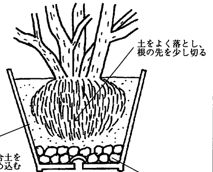
植え替えのしかた

夏にハダニがよく発生します。朝夕の葉水は防除に効果がありますが、発生がひどいときは殺ダニ剤を散布します。