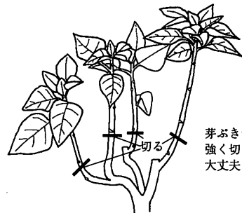
春の剪定のしかた

短日植物なので、夜遅くまで光が当たると発色が悪くなります。8月中旬以後は、苞葉が色づくまで夜間に光を当てないように注意しましょう。